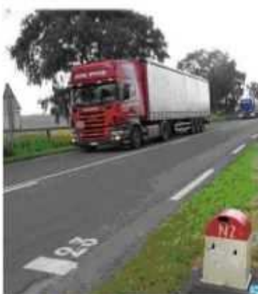
Le Parcours du combattant

Cette manifestation fait suite à celle menée par les élus de la Sambre Avesnois le 20 septembre dernier pour les mêmes revendications : alerter l'Etat sur l'urgence de l'aménagement d'une 2X2 voies, urgence en matière de sécurité routière et urgence pour le développement économique de la région enclavée.